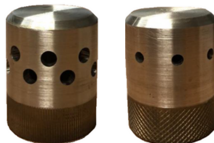
Ugelli 360° e 180°